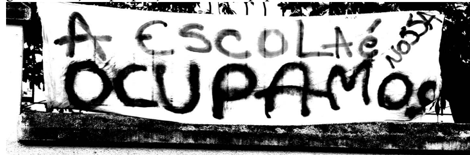
Faixa Escola Ocupada no Paraná, Outubro de 2016.

Em SC algumas instituições de Ensino já estão Ocupadas, como o IFC de Araquari. Sem dúvida esses projetos serão muito prejudiciais, não só aos estudantes, mas a toda população. Por isso é importante informar-se sobre sua luta e apoiar as escolas que estão ocupadas. Os politicos já demonstraram que estão do lado dos ricos e cabe a luta popular barrar essas medidas.