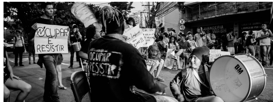
Manifestação em Niterói/RJ, 10 de maio de 2016.

Após se repetir em diversos estados, as ocupações chegam com força no Paraná. Hoje são cerca de 820 escolas ocupadas por todo o estado, e o número não para de crescer. A principal diferença desse movimento para os anteriores é que esse movimento luta contra os projetos Federais e não contra cortes estatuais. São contrários a reforma no Ensino Médio, como foi apresentado pelo governo federal sem dialogo algum e contra a PEC241. Esse movimento agora começa a ganhar força e proporção nacion-