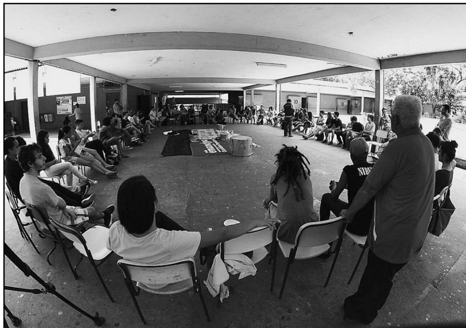
Encontro das Escolas de Luta na E. E. Brigadeiro Gavião Peixoto, em São Paulo, 28 de novembro de 2015.

Em 2015, os estudantes de São Paulo abriram o caminho para a resistência aos ataques do governo quando ocuparam diversas escolas no estado paulista contra a “reorganização” do governo de Geraldo Alckmin (PSDB), que também sem debate com os estudantes, professores e comunidade, pretendia fazer grandes alterações na suas estruturas de ensino e prevendo fechar cerca de 94 escolas. Imaginem o caos instalado, nas já lotadas escolas com essa proposta de maior